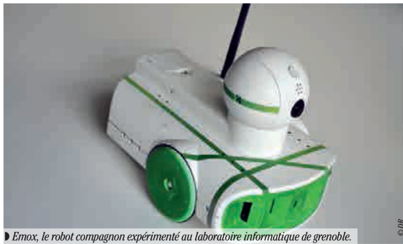
► Emox, le robot compagnon expérimenté au laboratoire informatique de Grenoble.